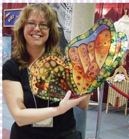
Un papillon qui a fait jaser!

Vous avez été nombreux à me demander comment faire le gros papillon lors du salon décoratif. Voici donc les informations à ce sujet: